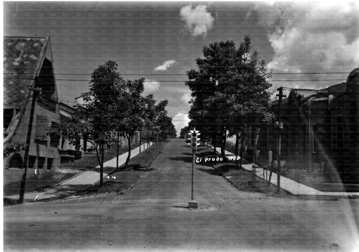
Benjamín de la Calle, El Prado , 1930. Archivo Fotográfico de la Biblioteca Pública Piloto de Medellín.

En la memoria colectiva se resalta entre otras remembranzas, la vida y acciones de aquellos que esculpieron con tesón obras que perduran en el tiempo, ideales que se fraguan entre lo sensorial y lo emocional, y que son a la vez, motivos esenciales en la percepción de la realidad. La vida y obra de “don” Ricardo Olano se describe dentro de estos valores. Labrador de una tierra de la cual empezaba a germinar el impulso cívico en la sociedad; además, fue un convencido de que el desarrollo urbano debía conjugarse con elementos naturales. En su planeación dominó el gusto por los árboles. No ajeno a sus principios, llevó a cabo el ideal del siempre cruzar lo natural con lo arquitectónico. Y así fue. El barrio Prado se levantó bajo unos ideales estéticos en los que se “...proponía un nuevo lenguaje visual, el del gran espacio, el de la voluptuosidad, el ingenio, el color, la figura y el detalle. Rescataba el jardín, el patio interior, y dotaba a la ciudad de vías sembradas con guayacanes amarillos o rosados, o de san joaquines enfrente de las grandes mansiones; se pensó para ser de alguna manera paradigma de bienestar”. 1